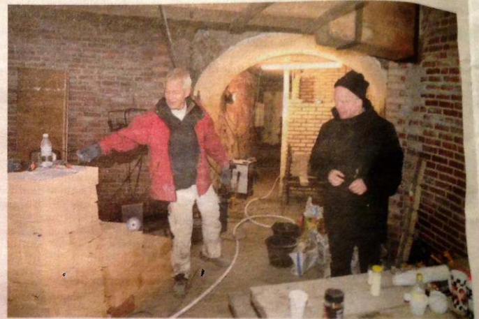
Det er her i kælderen under Nordskov Mølle, der fra 15. - 17. december vil være julestue.

- Vi håber selvfølgelig, at der kommer mange. Så støtter man os og projektet med