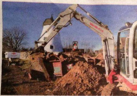
Mandag var kloakbyggeriet færdigt, og møllens gæster vil nu kunne komme på toiletlet under deres besøg.

Møllens to betondæk, der tidligere har været utætte, er nu blevet lavet, og håndværkerne lagde i går sidste hånd på gravearbejdet, der forbinder to kommende toiletter i