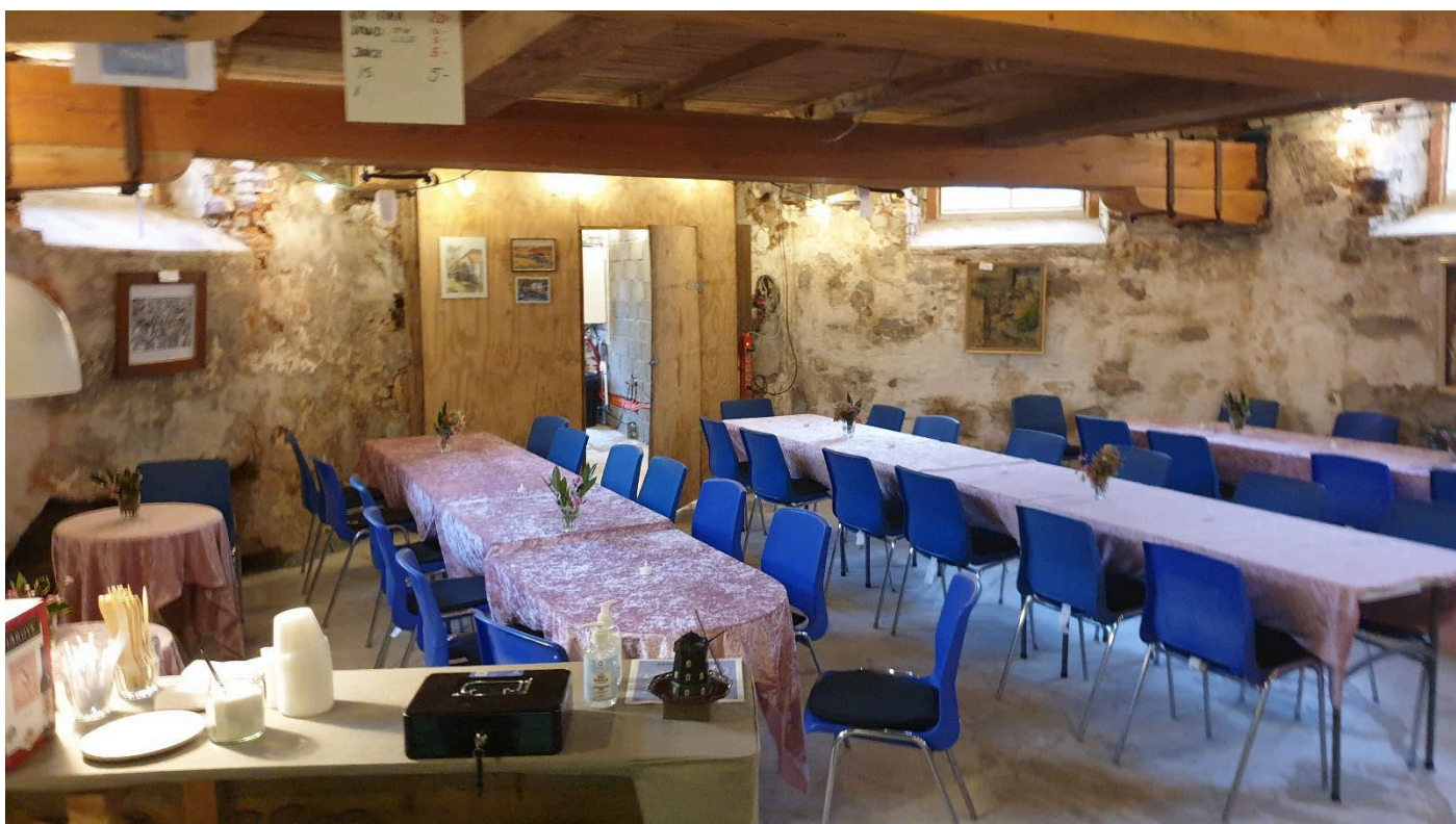
Her har vi dækket op med god Corona afstand til søndagens koncert.